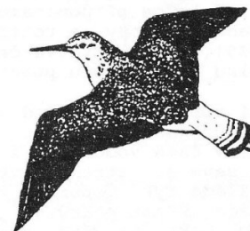
Vodouš kropenatý ( Tringa ochropus ). Kresba Lubor Urbánek.