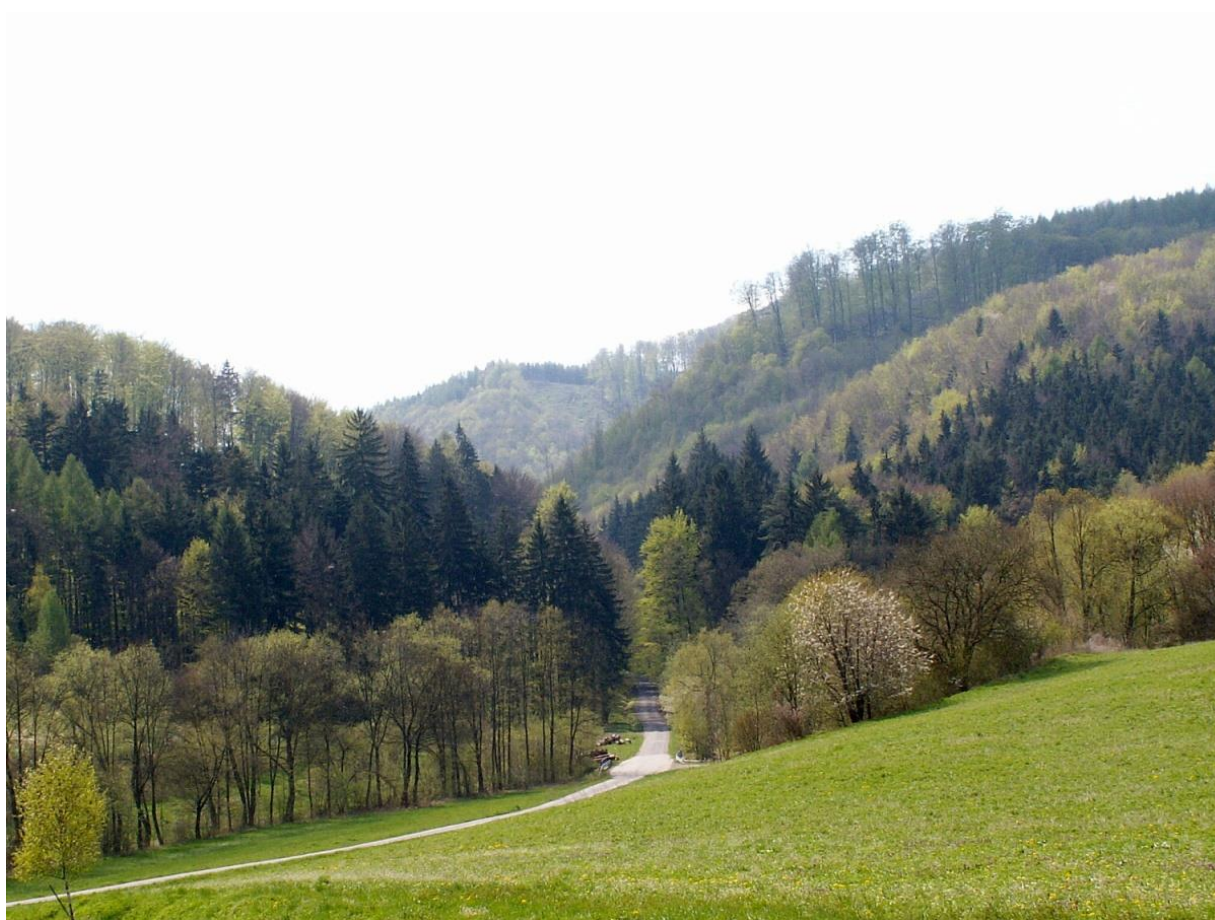
Obr.: Lesy mezi Vranovou Lhotou a Hartinkovem.

Víkendový výzkumný tábor je dlouholetou a tradiční akcí Východočeské pobočky ČSO. Od roku 2014, kdy probíhá mapování ptáků pro nový Atlas hnízdního rozšíření ptáků v ČR, volí výbor VČP ČSO místa konání VVT záměrně tak, abychom pomohli koordinátorům mapování pokrýt ta území regionu, v nichž data citelně schází. V letošním roce byla vybrána prakticky nezmapovaná oblast Malé Hané na rozhraní Pardubického, Jihomoravského a Olomouckého kraje. V okrese Svitavy se tak potkáme na VVT po 11 letech, v termínu od 12. do 14. května 2017 se zde uskuteční již 24. ročník pobočkového VVT.