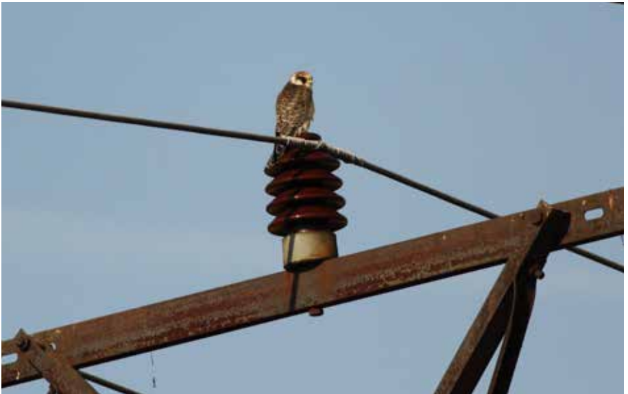
Obr. 2: Mladá poštolka rudonohá pozorovaná 8. 9. 2014 u Kamenné Horky na Svitavsku. Fig. 2: Juvenile Red-footed Falcon observed near Kamenná Horka (Svitavy district), 8. September 2014.