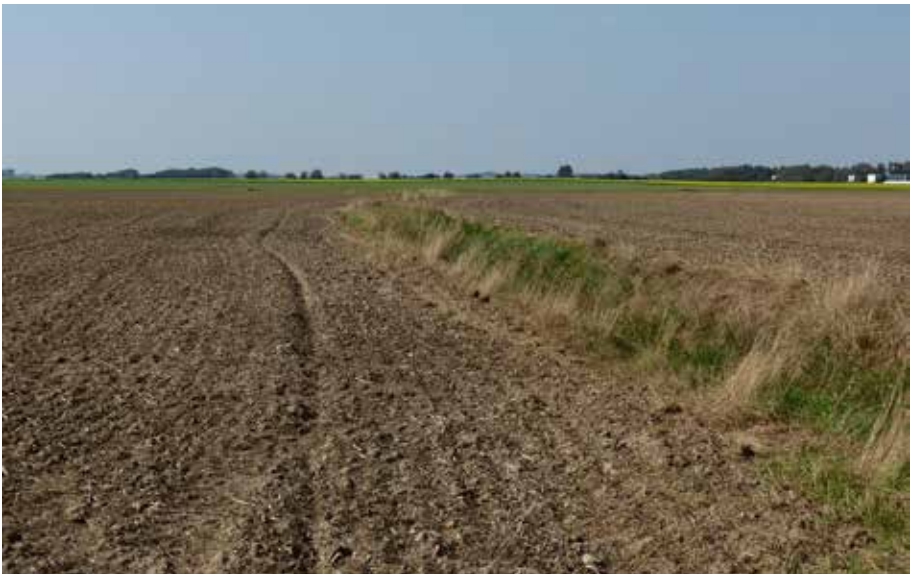
Obr. 3: Prostředí výskytu poštolek rudonohých ( Falco vespertinus ) u obce Nový Ples na Jaroměřsku v září 2014. Fig. 3: Foraging habitat of the Red-footed Falcon near Nový Ples (Náchod district) in September 2014.