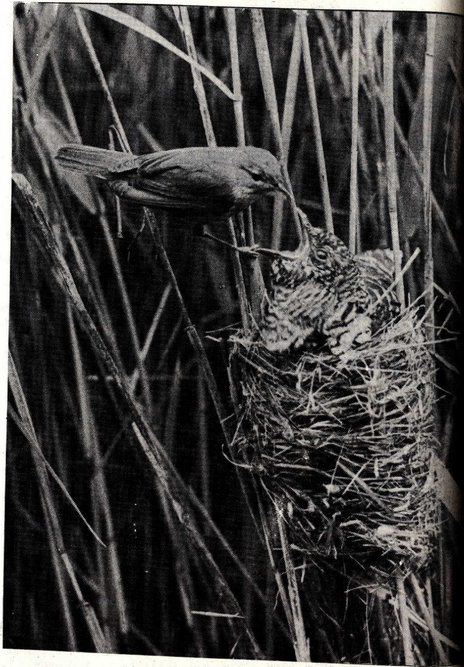
Kukačka ( Cuculus canorus ) a rákosník ( Acrocephalus scirpaceus )